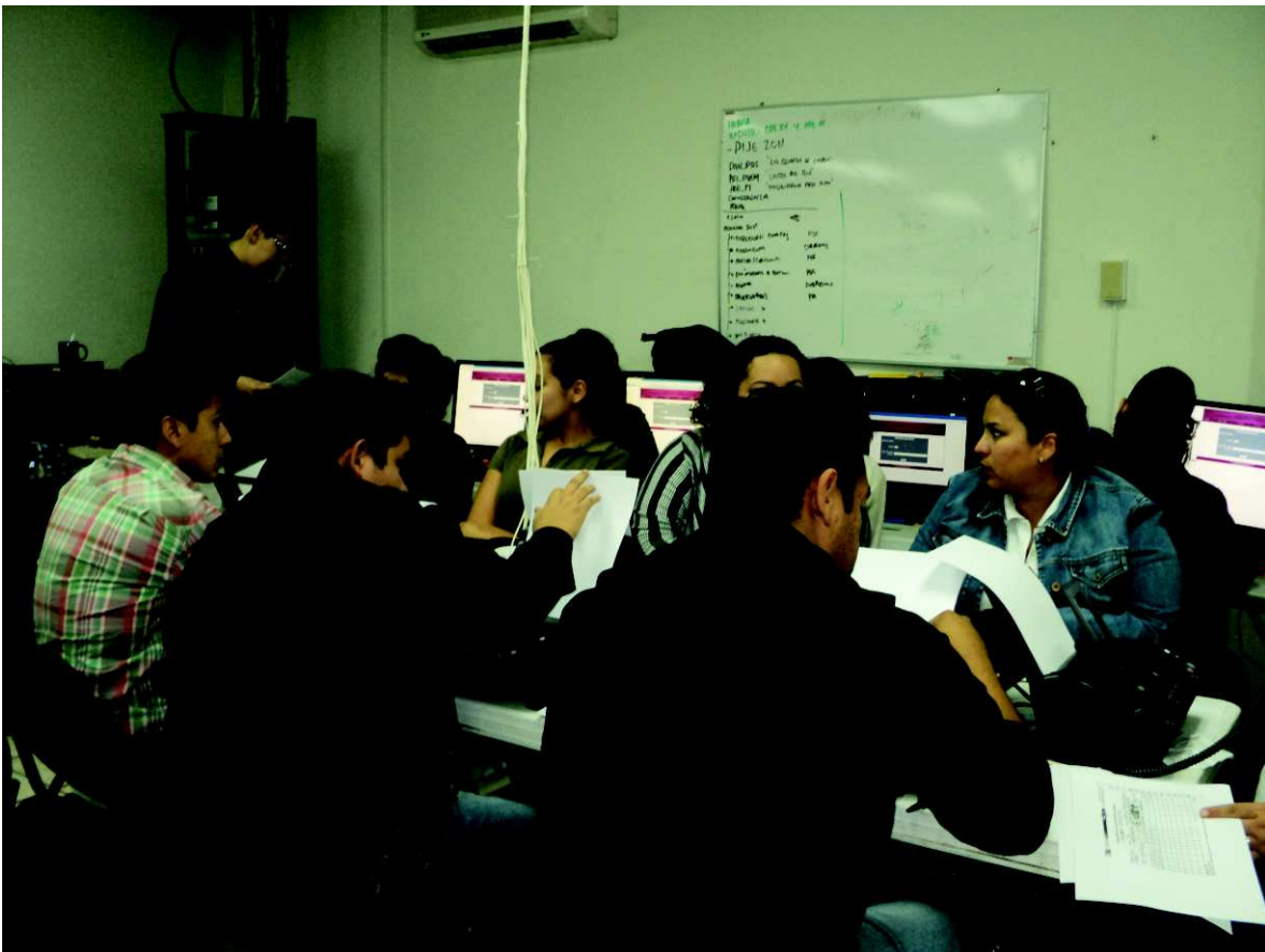
Centro de captura del PIJE.

Para la recepción y transmisión de esta información se contó con un número telefónico exclusivo en cada sede distrital, al cual el Auxiliar Electoral se debía comunicar de manera inmediata, y reportar la situación, para que a su vez el personal asignado en cada Comité Distrital informara al Presidente y a la sede del PIJE en el Instituto Estatal Electoral en la Comisión de Organización Electoral, quienes de manera inmediata hacían llegar la información al Consejo General mediante la Consejera Presidenta.