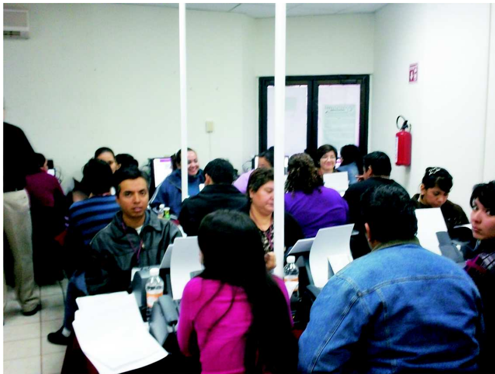
Arriba Centro de recepción PREP. Abajo Centro de captura del PIJE.