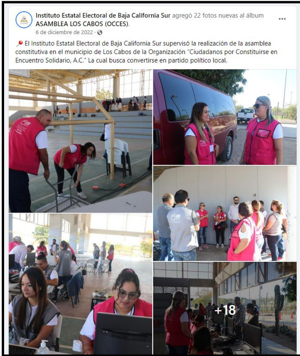
Imagen 1. Relativa a la publicación con más alcance en el mes de diciembre.

en el municipio de Los Cabos de la Organización "Ciudadanos por Constituirse en Encuentro Solidario" con 287 personas alcanzadas.