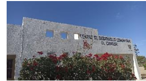
Divulgación de convocatorias en instituciones educativas