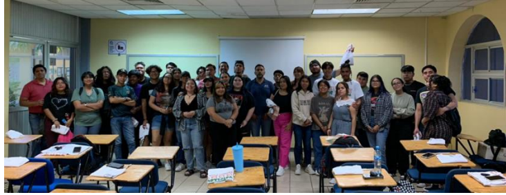
Plática "¿Cómo votar?" en la UABCS

De esta manera, se avala al Instituto Estatal Electoral de Baja California Sur como órgano garante de este derecho en la entidad.