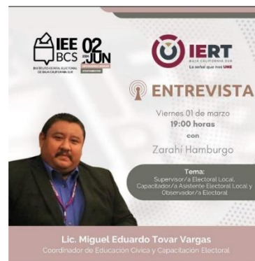
Promocionales de entrevistas sobre la promoción a la observancia electoral