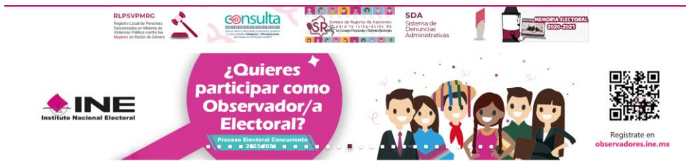
Banner de promoción convocatoria para la observancia electoral en minisito

Respecto a los quehaceres institucionales para la promoción del derecho a la observancia electoral a través de medios de comunicación masivos se subraya en principio, aquellos de modalidad digital: De este modo, desde el mes de septiembre de 2023, se visualizó en el minisito institucional la convocatoria para la ciudadanía interesada en su acreditación como observadora u observador electoral.