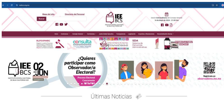
Banner 2 de promoción convocatoria para la observancia electoral en minisito

Mientras, a través del mismo espacio en el mes de diciembre de la dicha anualidad, fue colocado un nuevo banner con la convocatoria emitida desde este Órgano Electoral; asimismo, en misma fecha fue publicado un boletín informativo con la invitación a la ciudadanía a participar como observador u observadora electoral en el proceso electoral concurrente 2023-2024