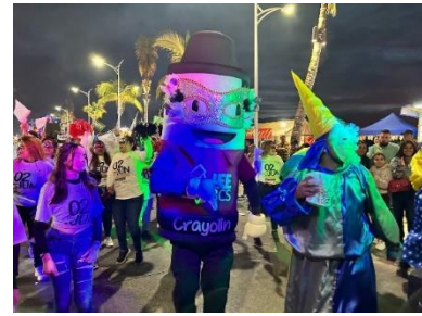
Participación durante el Carnaval La Paz 2024 "México Fantástico"

De igual forma, sobresale la entrega de volantes a los órganos desconcentrados, a efecto de potenciar el alcance de las acciones de promoción a la observancia electoral, en el mes de marzo se remitieron a las personas que presiden los órganos desconcentrados del IEEBCS, volantes alusivos a la convocatoria para la ciudadanía interesada de participar como observadoras y observadores electorales con el propósito de ser distribuidos en sitios de gran afluencia.