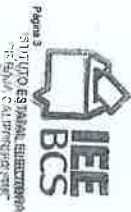
Figura 3 INSTITUTO ESTADAL ELECTORAL DE BAJA CALIFORNIA SUR